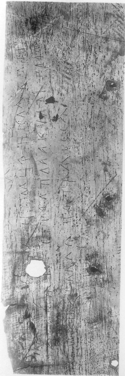
Владимирская надпись 1340 года (спимокъ въ натуральную величину).