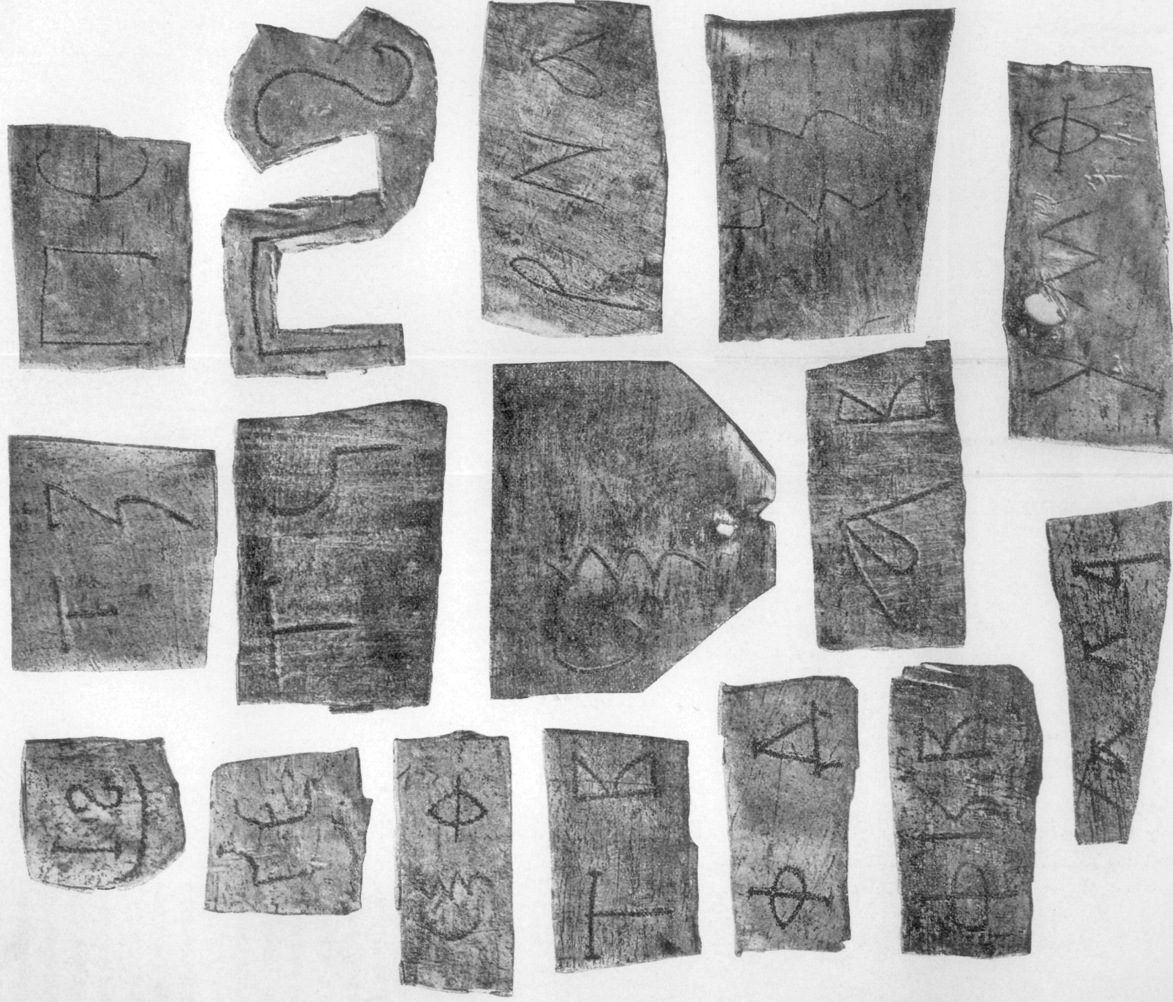
Вырезки изъ мѣдныхъ листовъ древней кровли Успенскаго Собора въ г. Владимирѣ на Клязьмѣ.