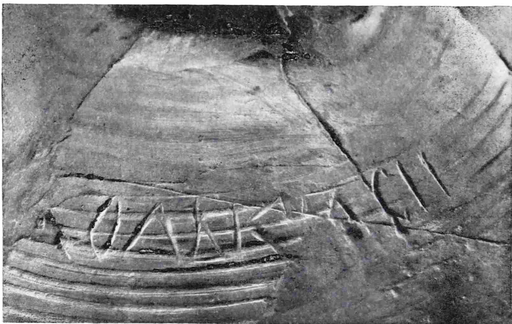
Рис. 2. Надпись на амфоре из Новогрудка

При склейке амфоры полностью составила и надпись (рис. 2). Она процарапана острым инструментом по обожженному сосуду и состоит из одного слова «олѣкъсн», обозначающего, по-видимому, имя владельца (Алексий) 12 . Надпись безусловно не имеет продолжения. Однако и перед словом «олѣкъсн» не было никакого другого, так как расстояние между буквой «о» и краем черепка значительно больше, чем интервалы между буквами, а промежутки между словами в то время, как известно, отсутствовали. По геометрическому стилю письма и симметричности отдельных букв надпись характерна для устава XI—XII вв.: «о» и «с» с заостренными концами, симметричные «л» и «к», «и» с горизонтальной перекладиной, «ѣ» и «ъ» с треугольными петлями. К тому же мачта «ѣ» чуть выходит за пределы верха строки, а коромысло (очень слабо выраженное) находится на ее уровне, что является признаком XII в. 13 Наличие у буквы «л» наверху, справа крючка (если он не случайный), выражающего сильное смягчение этого звука, характерно лишь для XI и первой половины XII в. 14 Данные фонетики также не позволяют отнести надпись ко времени, более позднему, чем XII век. Об этом свидетельствует употребление «ъ» там, где в XIII в. его стали заменять буквой «о» или опускать вовсе (например: сънь — сонь, лъожь — ложь, мънозь — мнозь) 15 .